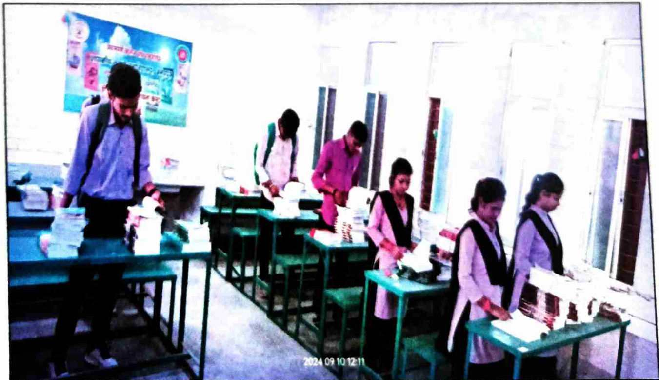
पुस्तकों का निरीक्षण करते विद्यार्थीगण